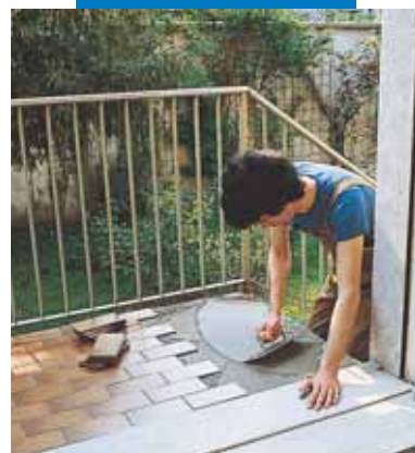
Hidroizolacija, izravnavanje i polaganje sa Kerabond-om T + Isolastic