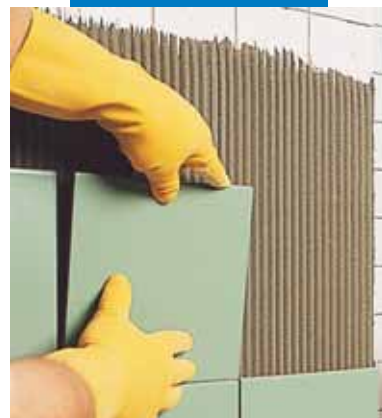
Polaganje preko starih pločica