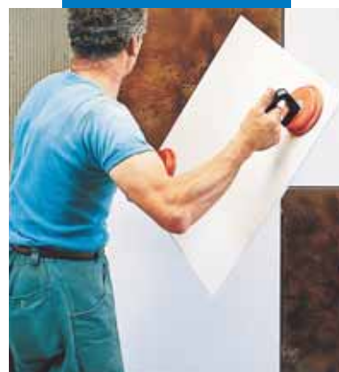
Polaganje KERAION-a na zid