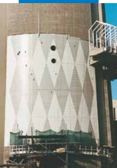
Primer polaganja klinkera na beton sa Kerabond-om + Isolastic - Novi Telekomunikacijski Toranj- Kuvajt (Kuvajt)