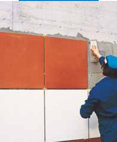
Polaganje velikoformatnih pločica sa Kerabond-om T + Isolastic