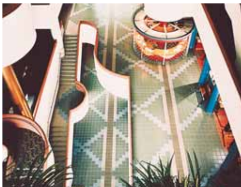
Polaganje keramičkih pločica od porculaniziranog gresa sa lepkom Kerabond + Isolastic, Civic Center - North York Ontario (Kanada)

nazubljenu lopaticu, u zavisnosti od vrste i veličine pločica. Npr: